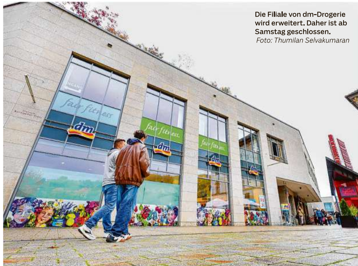
Die Filiale von dm-Drogerie wird erweitert. Daher ist ab Samstag geschlossen.